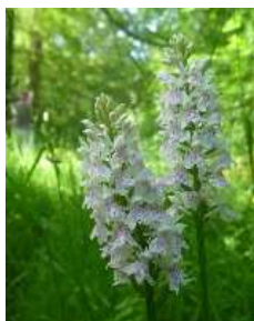
Orchis de Fuchs

Enfin, nous avons évidemment découvert une partie du patrimoine naturel de ce territoire, par la traversée du bois de Doat et des prairies longeant la Gélise. Chevreuil, Pic noir et Orchidées étaient au rendez-vous !