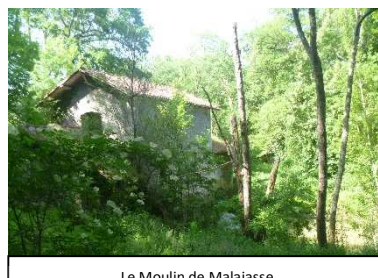
Le Moulin de Malajasse

Cette balade nous a également permis de découvrir le patrimoine culturel de la région, à travers l'église de Mauras, inscrite aux monuments historiques depuis 1998, dédiée à Notre-Dame et datant du 14 e siècle, qui constitue l'une des sept églises de