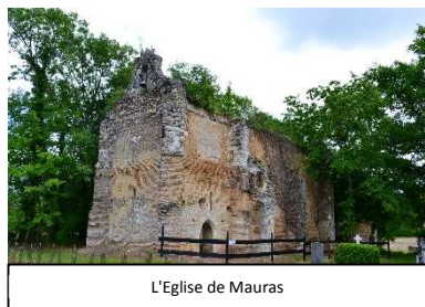
L'Eglise de Mauras

Cette balade nous a également permis de découvrir le patrimoine culturel de la région, à travers l'église de Mauras, inscrite aux monuments historiques depuis 1998, dédiée à Notre-Dame et datant du 14 e siècle, qui constitue l'une des sept églises de